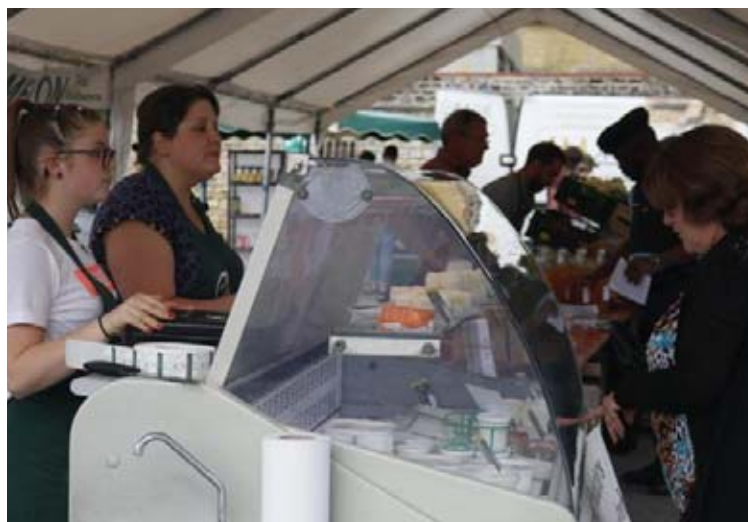
Une quinzaine de producteurs locaux sont attendus.

Le prochain marché de terroir aura lieu le vendredi 16 août, de 16 h 30 à 19 heures sur la place de la mairie. Une quinzaine de producteurs locaux seront présents, ainsi, les consommateurs pourront s'approvisionner en fruits et légumes, fromages et yaourts, viande Salers, miel, produits au lait d'ânesse, charcuterie, lentilles, escargots, confitures, vins, etc. En juin, Marie-Chantal Noury, maire, signalait : « Ce marché est un pari pour nous, les élus et le collectif, mais aussi pour les producteurs et les commerçants, qui ont pour challenge de dévoiler au public leur savoir-faire et faire apprécier la qualité de leurs productions. Sa pérennité dépend surtout des consommateurs qui le fréquenteront. Ils pourront choisir des aliments de qualité, lors d'un moment de détente, qui rapprochera chacun autour des étals dans l'esprit du bien